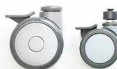
Apertura della base a pedale