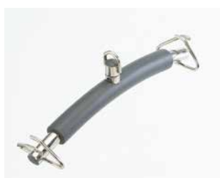
Bilancino a 2 punte