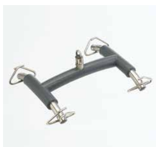
Bilancino a 4 punte