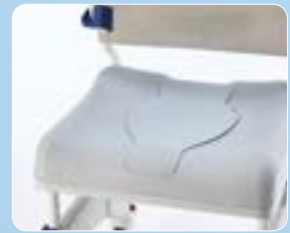
Tappo per sedile morbido con foro piccolo