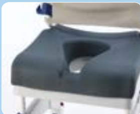
Sedile morbido ergonomico