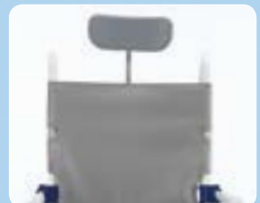
Schienale Comfort ▲