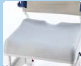
Sedile morbido universale