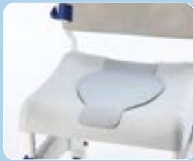
Tappo sedile morbido