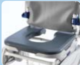
Sedile foro variabile