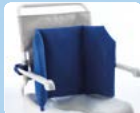
Riduttore morbido ▲