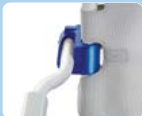
Braccioli XL più larghi