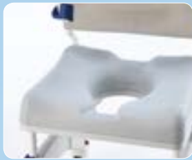
Sedile morbido standard