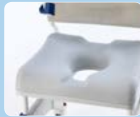
Sedile morbido con foro piccolo