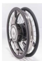
Asse per il trasporto