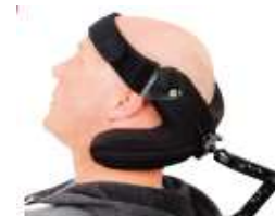
fascia supporto capo