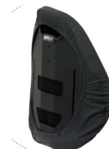
fodera di protezione