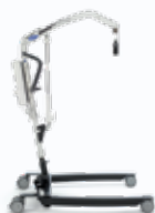
Birdie EVO COMPACT

▶ Estremamente compatto per una manovrabilità superiore