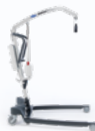
Birdie EVO PLUS

▶ Un nuovo standard nell'ambito del sollevamento delle persone