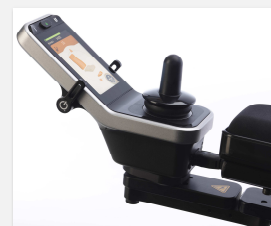
Dettaglio comando touch screen REM400 con selettori laterali