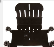
Porta ventilatore / concentratore Ossigeno BXE1070