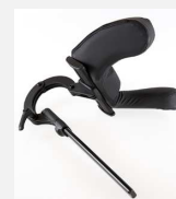
Poggiatesta con supporti mandibolari BXE1060