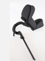
Poggiatesta con alette parietali BXE1040