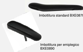
Imbottitura standard BXE0870