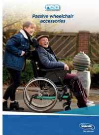
L'immagine può differire dalla configurazione standard